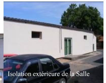
Isolation extérieure de la Salle