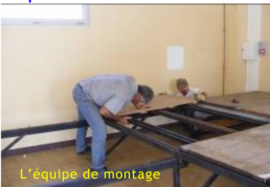
L'équipe de montage

La municipalité c'est enrichi d'un Podium, offert gracieusement à la commune, à l'initiative d'un conseiller municipal.